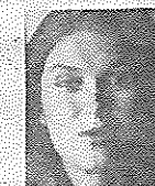
AF CHILI TURÉLL

punkt. Så hvis vi ikke er døde af nitritforgiftning forinden, og hvis havet ikke i mellemtiden er blevet endeligt og gennemgribende inficeret af cancerfræmkaldende zebraalger, så har vi da lov til at håbe på et snarligt gensyn med Charlottenlund Søbadeanstalt. Har vi ikke?